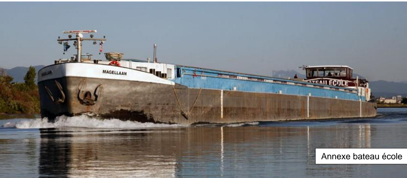
Annexe bateau école

CONSTRUISONS ENSEMBLE LES TALENTS DE DEMAIN