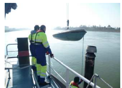
Matelots en action

L'activité du tourisme repose sur des interactions humaines. Les membres du personnel accueillent les voyageurs et il est donc bénéfique qu'ils aient des compétences de base en anglais. Ils sont également responsables du bien-être et de la sécurité des passagers à bord du bateau.